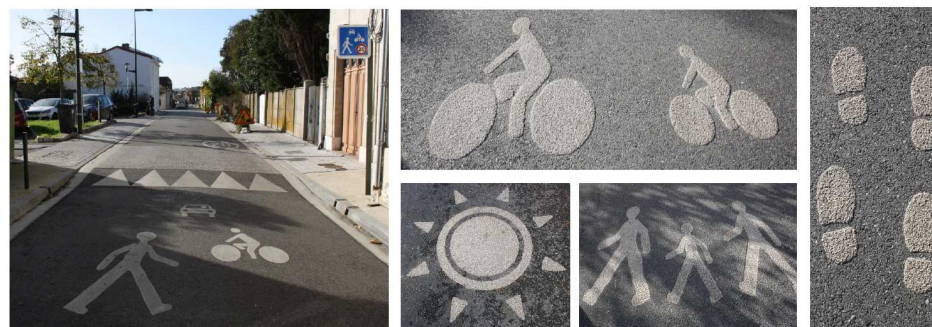
Zone de rencontre, Rue Renaudel, Bègles .

La chaussée sera reprise par la mise en œuvre d'un tapis neuf pour permettre la réalisation de marquage d'animation (comme sur la rue Renaudel traitée en zone de rencontre sur une partie)