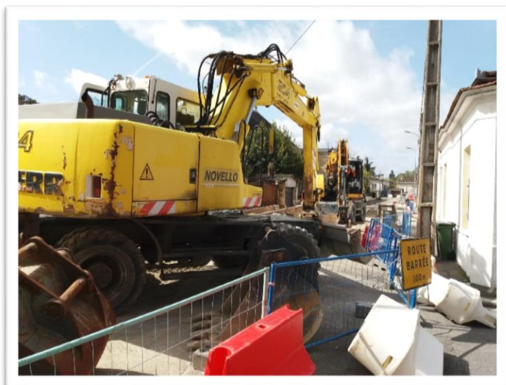
Travaux en cours rue Lapelleterie.