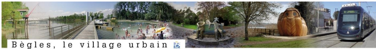
Bègles, le village urbain