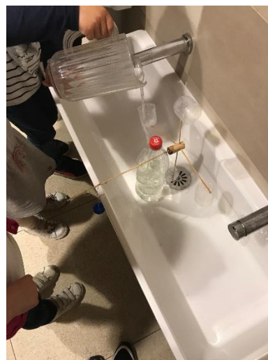
Exemples de réalisations menées dans les points d'accueil maternels, autour du soleil, de l'eau et du vent.