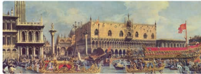
Canaletto, Le Retour du Bucentaure