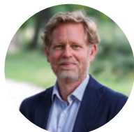
Clément Rossignol Puech Maire de Bègles et vice- président de Bordeaux Métropole